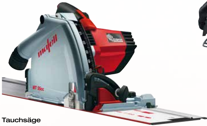
Tauchsäge MT 55 cc MidiMAX im T-MAX mit F 160