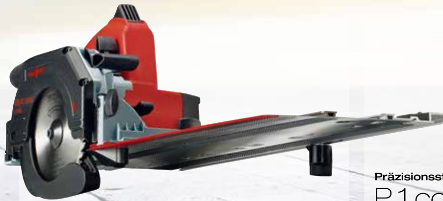
Kappschiene-Säge KSS 40 18M bl im T-MAX Art.Nr.: 919801