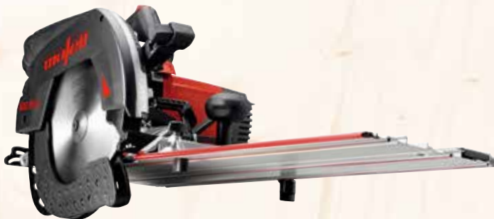
Kappschiene-Säge KSS 80 cc /370