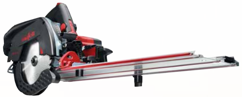
Kappschiene-Säge KSS 50 18M bl