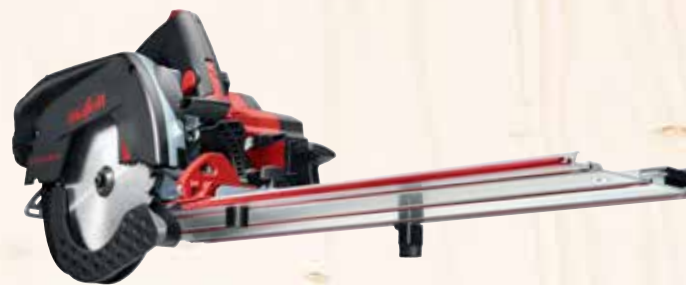
Kappschiene-Säge KSS 60 18M bl